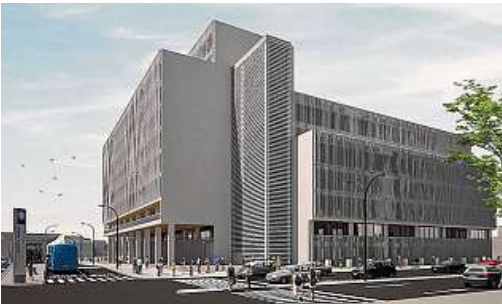
Cada torre cuesta alrededor de 60 mil millones de pesos. El proyecto cambiará totalmente el centro de la ciudad.