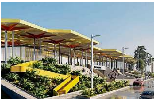
Al finalizar el año arrancaría la construcción del Búnker de la Fiscalía. Así se verá la zona cuando este terminado.

hace 12 años, El Calvario con su estación Central inició en el 2014 - 2015 y San Pascual en el 2017.