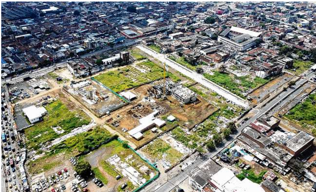
El proyecto de renovación urbana está localizado entre Carreras 10 y 15 y las Calles 12 y 15, en El Calvario y San Pascual

La Ciudadela de la Justicia, compuesta por el Búnker de la Fiscalía arrancó